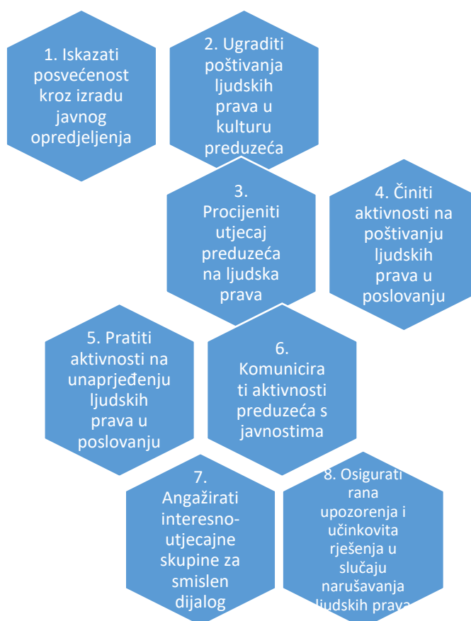
Slika 2: Osam elemenata plana za implementaciju stuba II

Plan za implementaciju stuba II od strane poslovnih subjekata može se sažeti u osam elemenata: