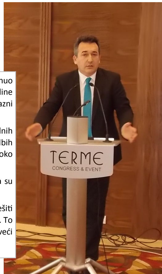
Erdal Trhulj, Ministar FMERI

Erdal Trhulj, ministar energije, rudarstva i industrije u Vladi FBiH, osvrnuo se na rad u prehodnom mandatu i rekao da su u protekle četiri godine imali dobrog partnera u Udruženju poslodavaca FBiH. Smatra da su razni analitičari u medijima iznosili često i neadekvatne tvrdnje.