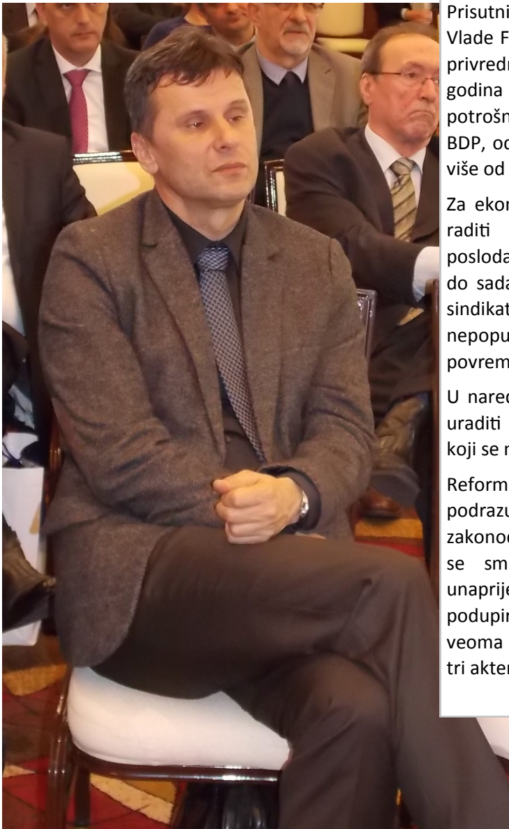
Fadil Novalić, novi mandatar Vlade FBiH

Prisutnima se obratio Fadil Novalić, novi mandatar Vlade FBiH, koji je rekao da nam predstoji aktivna privredna reforma. Kako je naveo zadnjih šest godina BDP bilježi pad, a zadnjih deset godina potrošnja i zdravstvo rasli su oko 80% u odnosu na BDP, odnosno rasli su i penzioni fondovi za 80,7% više od BDP-a.