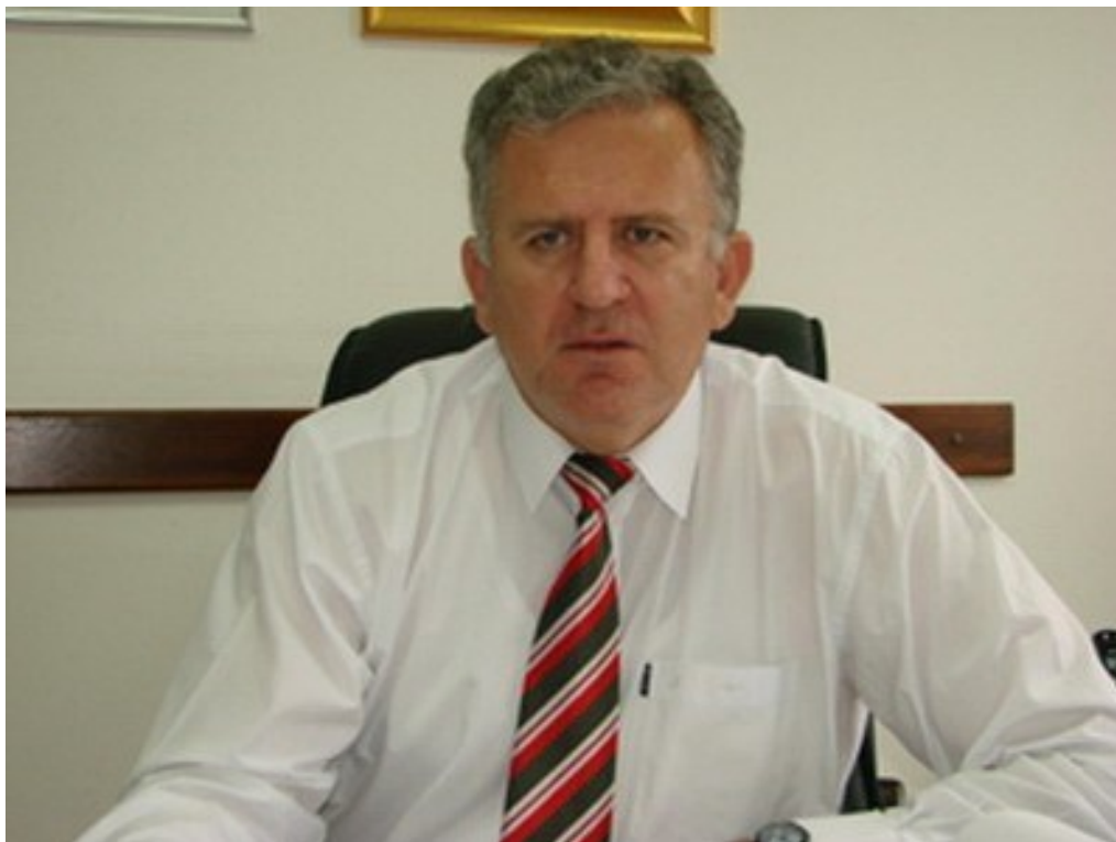
Safudin Čengić, predsjednik UP FBiH

Udruženje poslodavaca u Federaciji od vlasti traži hitno provođenje mjera za rasterećenje privrede i izmjene zakonske regulative u ovoj oblasti, prvenstveno Zakona o radu.