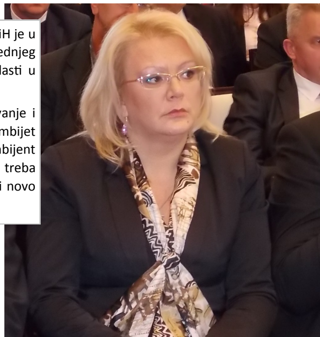
Lidija Bradara, predsjedavajuća Doma naroda Parlamenta FBiH

“Na nama je da u svakom pogledu olakšamo vama poslovanje i osiguramo uvjete kroz zakonodavnu vlast da imate ambijet poslovni koji vam je potreban, te da imate bolji poslovni ambijent kako bismo privukli i strane investitore. Javna uprava treba prilagoditi gospodarstvenicima, kako bismo mogli stimulisali novo poslovanje i jačati domaće poslovanje”, istakla je Bradara.