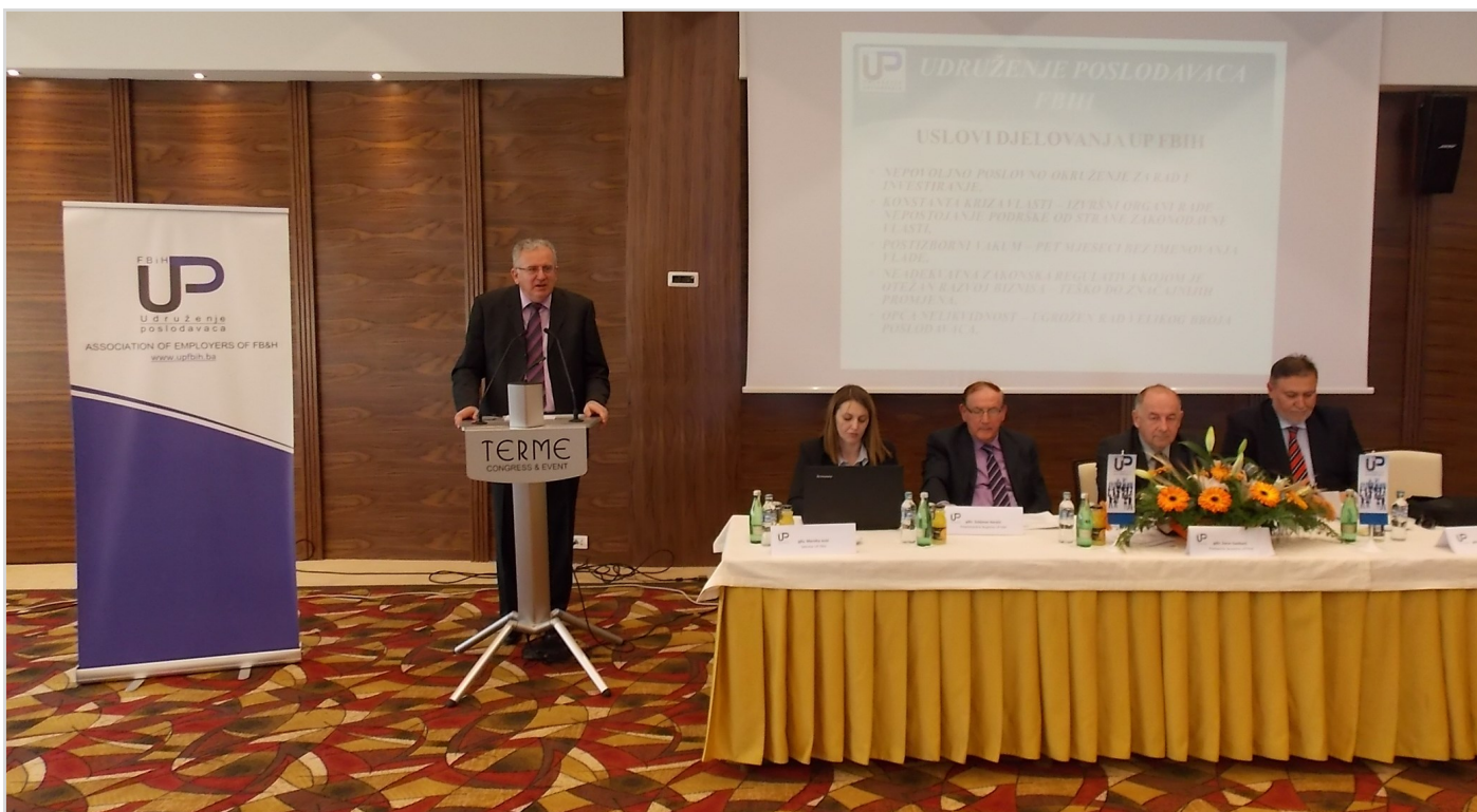
Izlaganje Predsjednika UP FBiH Safudina Čengića